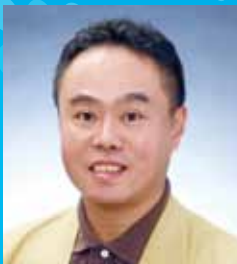
木村 幹 神戸大学大学院 国際協力研究科教授